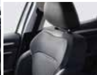
sellerie mixte similicuir / tissu carbone texturé