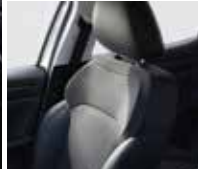
sellerie tissu noir et gris foncé