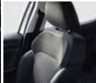
sellerie tissu carbone foncé