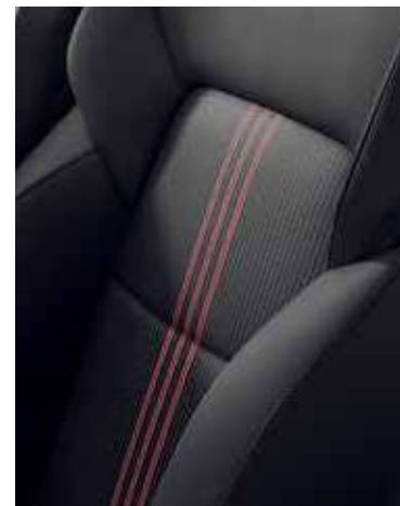
RS Line (Intens+), sellerie mixte spécifique R.S. line