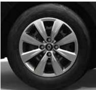
Life, enjoliveurs 15" Irima