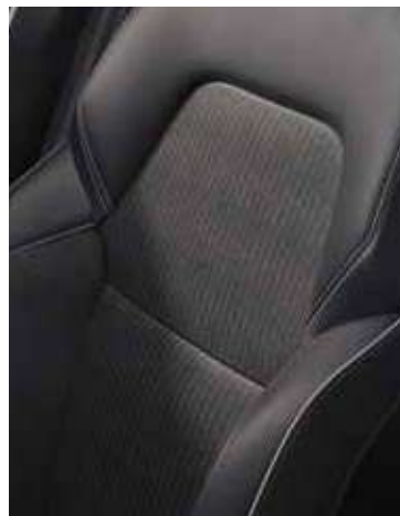
Intens (Explore+), sellerie mixte tep / tissu