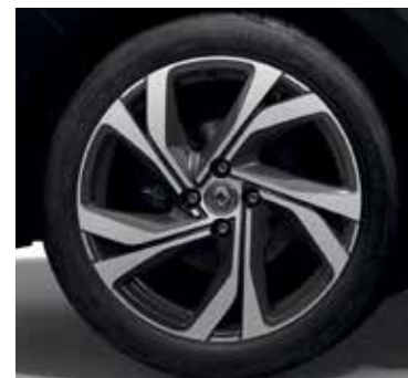
RS Line (Intens+), jantes alliage 17" Magny-cours R.S. line