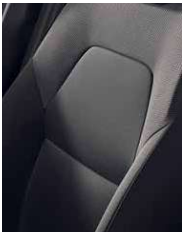
Life, sellerie tissu noir