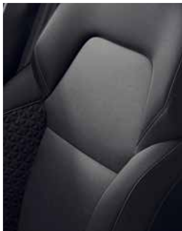
Explore (life+), sellerie Tissu Noir avec motifs surpiqués