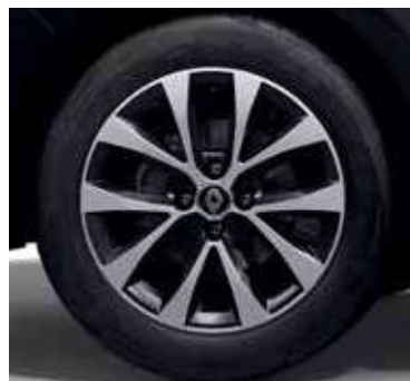
Explore (life+), jantes alliage 16" Philia diamantées noir