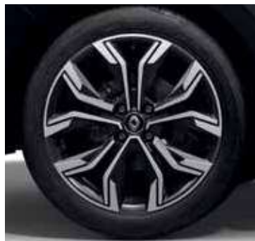
Intens (Explore+), jantes alliage 17" Viva Stella diamantées noir