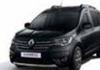
Noir Nacré (2)