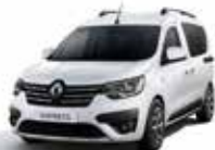
Blanc Glacier (1)