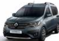
Gris Urban (1)