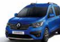
Bleu Iron (2)