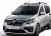
Gris Highland (2)