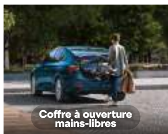
Coffre à ouverture mains-libres