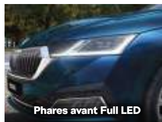
Phares avant Full LED