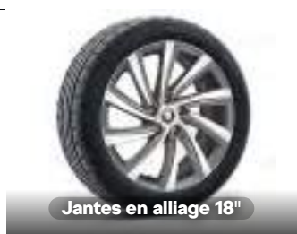
Jantes en alliage 18"