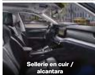
Sellerie en cuir / alcantara