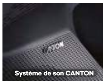
Système de son CANTON