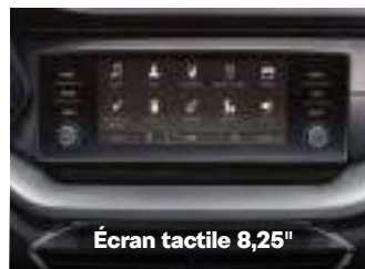
Écran tactile 8,25"