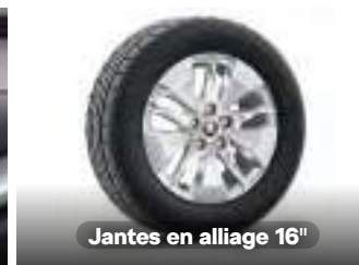
Jantes en alliage 16"