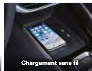
Chargement sans fil