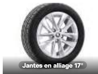
Jantes en alliage 17"