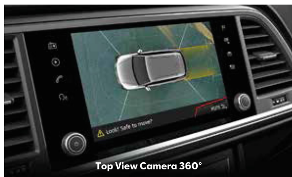
Top View Camera 360°