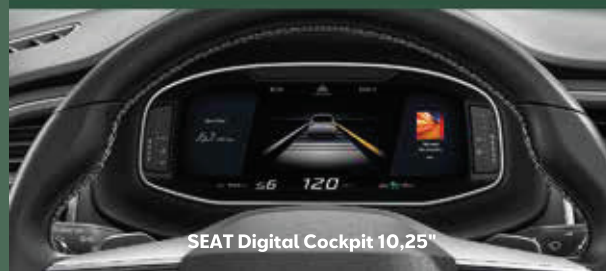
SEAT Digital Cockpit 10,25"