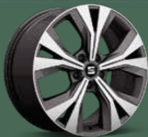
Jantes alliage 18" Performance Machined