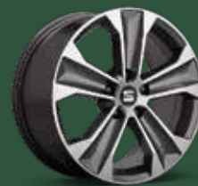
Jante alliage 17" Dynamic Machined